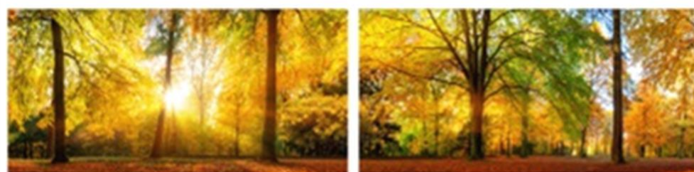
FP 2 – N°11