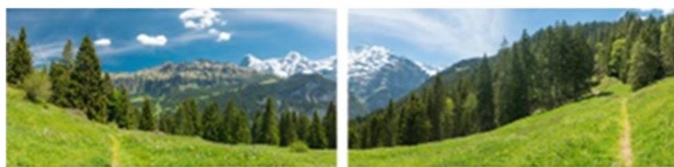
FP 2 – N°7