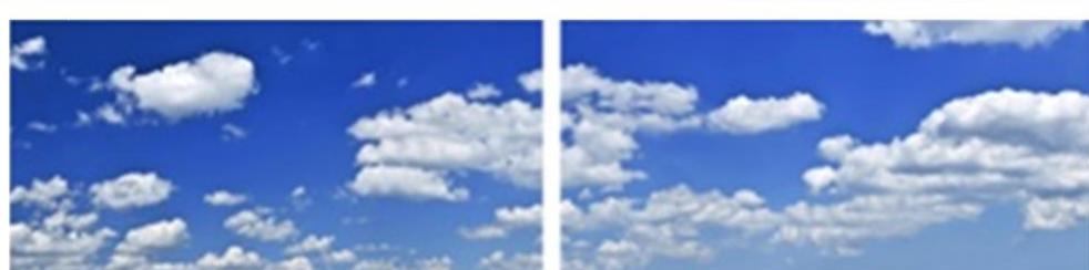
FP 2 – N°3