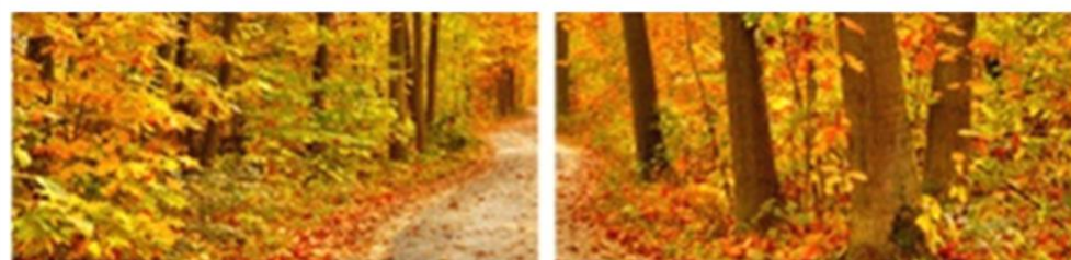
FP 2 – N°14