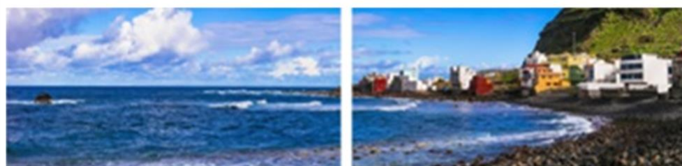
FP 2 – N°17