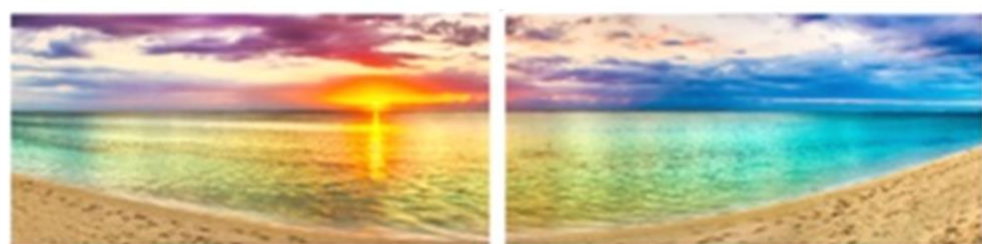
FP 2 – N°4