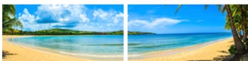
FP 2 – N°6