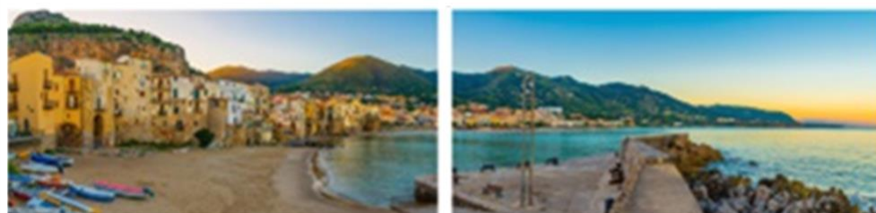
FP 2 – N°18