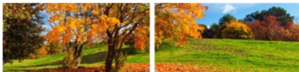
FP 2 – N°9